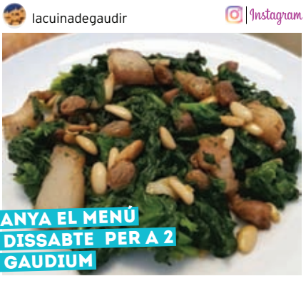
GUANYA EL MENÚ DE DISSABTE PER A 2 DE GAUDIUM

El concurs d'Instagram del #totataula està fent furor. Cada setmana són més els "igers" maresmencs que no dubten a immortalitzar els plats que elaboren o que es cuspeixen en algun dels restaurants. Participar és molt fàcil, tan senzill com etiquetar les teves fotografies amb #totataula i podràs optar a alguns dels premis setmanals dels nostres restaurants col·laboradors.