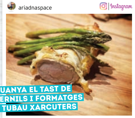
GUANYA EL TAST DE PERNILS I FORMATGES A TUBAU XARCUTERS